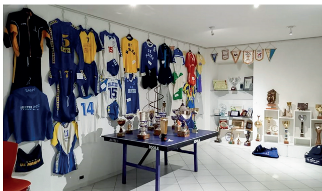
La mostra per i 50 anni dell'U.S. Marter

mini cuccioli che si sono dati battaglia su un tratto di 300 metri della via principale di Roncegno , per terminare con atleti, non più giovanissimi, che si sono sfidati lungo un percorso che si snodava per il centro storico di Roncegno e che ha premiato l'impegno di tutti gli organizzatori ed un gran numero di volontari di altre associazioni ed esercenti della zona.