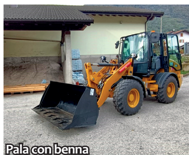
Pala con benna