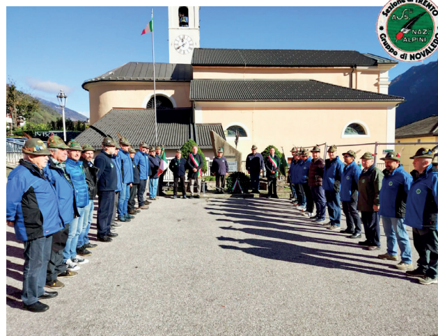
Onore ai Caduti, 5 novembre 2023

Sempre in questo mese si è ripetuta una scadenza storica (una volta Festa Nazionale), la commemorazione dei Caduti di tutte le guerre: nella prima domenica di novembre infatti, sempre condivisa con i paesi limitrofi, gli Alpini hanno deposto corone nella piazza comunale ai