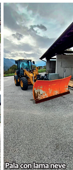
Pala con lama neve