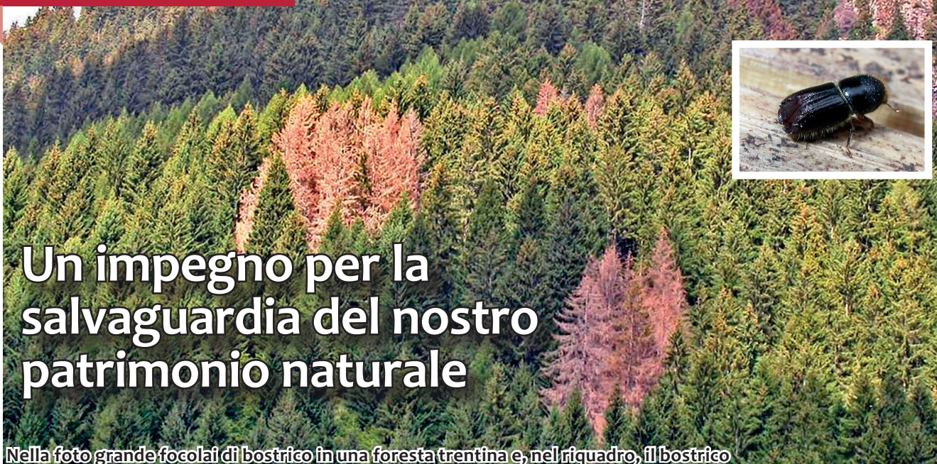
Nella foto grande focolai di bostrico in una foresta trentina e, nel riquadro, il bostrico

C ari cittadini, approfitto del nostro giornale per parlare di una minaccia grave e urgente che sta mettendo a rischio il nostro patrimonio naturale: il bostrico delle foreste trentine. Questo insetto, noto anche come Scolytus scolytus , sta causando danni significativi alle nostre foreste, mettendo a repentaglio la biodiversità e l'equilibrio degli ecosistemi.