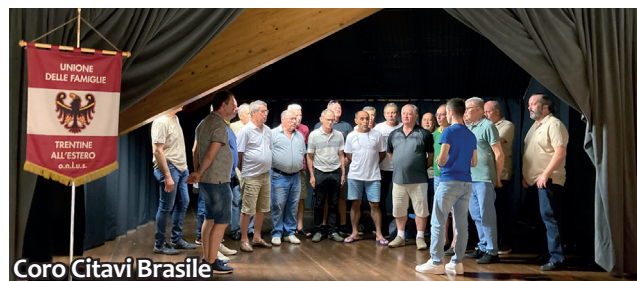
Coro Citavi Brasile