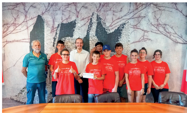
Progetto “Ci sto affare fatica”