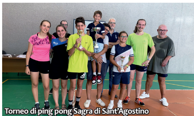
Torneo di ping pong Sagra di Sant'Agostino

Un progetto complesso, strutturato su quattro serate formative (tenutesi tutte in sala polivalente) e quattro giorni di viaggio, con tappe a Banja Luka , Stivor e Sarajevo . Conoscere la migrazione trentina a Stivor , nonché la tragedia della guerra a Sarajevo e nei Balcani , ci aiuta a