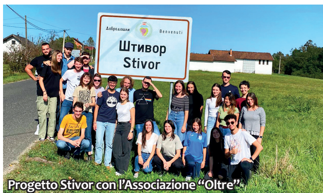
Progetto Stivor con l'Associazione "Oltre"

sta direzione e che stiamo portando avanti ormai da più di un anno è quella con l'associazione Kaleidoscopio , che fa attività con i più piccoli (dalla prima media alla seconda superiore) al giovedì presso la sala lettura di Novaledo , e al venerdì presso la sala tre castelli di Roncegno Terme .