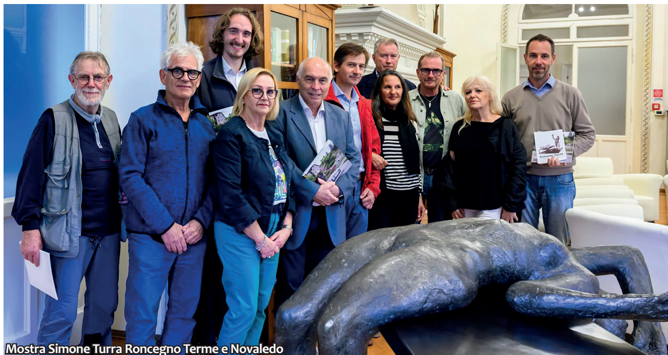
Mostra Simone Turra Roncegno Terme e Novaledo

ne trentina al fronte italiano durante la seconda guerra mondiale. 25 mila soldati brasiliani che hanno combattuto dal '44 al '45 per la liberazione dell'Italia.