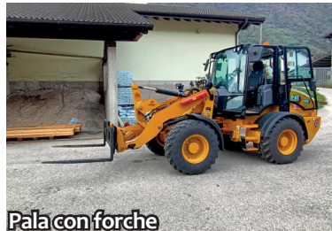
Pala con forche