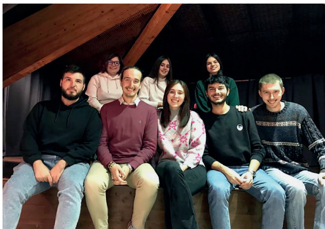
Il direttivo di "Oltre"

confini: destinazione Dachau". Dopo due serate di formazione per prepararci ad un viaggio così importante, il 17 marzo siamo partiti, con un gruppo di 50 partecipanti, con destinazione Monaco di Baviera , per la visita al campo di concentramento di Dachau . Per molti è stata la prima visita ad un campo nazista, per tutti un'esperienza carica di emozioni intense. Sono stati giorni da cui ognuno ha portato via riflessioni, risposte, o forse solo altre domande di fronte all'indicibile crudeltà di quelle storie. Quello che abbiamo compreso senza dubbio, però, è stato il valore di fare un'esperienza così forte in gruppo.