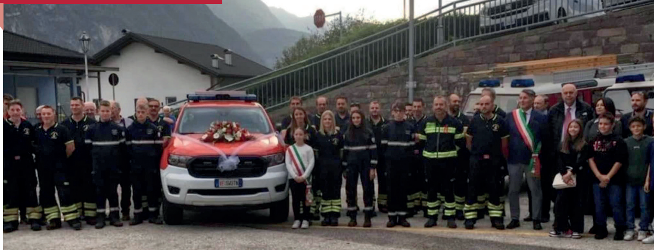
Il nuovo mezzo dei VVF di Novaledo: sopra l'inaugurazione in piazza a Novaledo e, sotto, in azione in Friuli Venezia Giulia