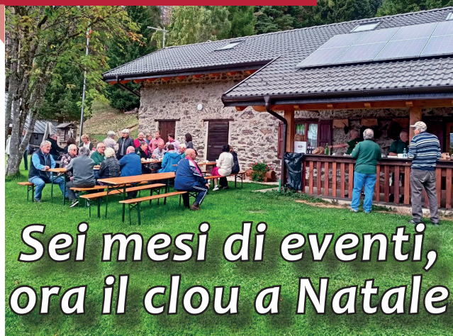
Malga Broi, 15 agosto 2023

Incontro fraterno in luglio a Bieno in occasione del 60° di fondazione di quel Gruppo nello spirito di solidarietà e amicizia che anima gli Alpini .